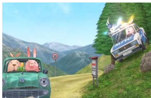
圖 2.1 監獄兔 ← 圖名稱自訂